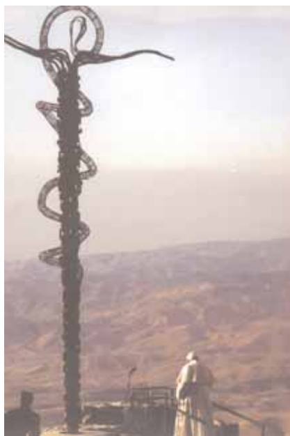
Papież przy wywyższonym wężu (symbolu szatana) w pozie uwielbienia - poddania szatanowi