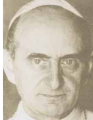
Papież Paweł VI