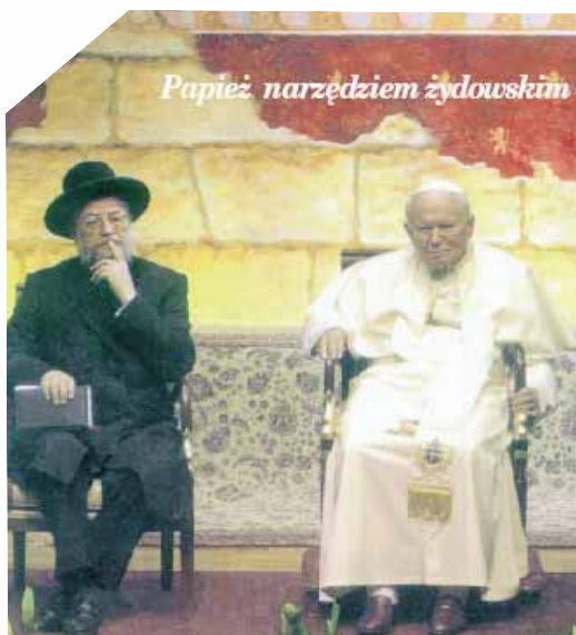
Wypłynąłem na głębię, nie lękajcie się!

Prócz tego talent rządzenia masami i osobami przy pomocy zręcznej dobrotliwej teorii i frazeologii, przepisów o współzyciu i wszelkich innych podstępów, o których goje nie mają pojęcia – należy do celów specyficznych naszej mądrości administracyjnej, wykształconej na analizie, na takich subtelnościach rozumowania, w których dziedzinie nie mamy konkurentów, tak samo, jak nie mamy ich w sferze solidarności i układania planów politycznych. Jedynie ich Jezuiaci mogliby pod tym względem równać się z nami, lecz potrafiliśmy ich zdyskredytować w oczach tłumu bezmyślnego, jako organizację jawną, pozostając sami w ukryciu z naszą organizacją tajną. Zresztą, czyż to dla świata nie jest obojętne, kto będzie jego władcą: Głowa kościoła katolickiego – czy nasz despot z krwi syjońskiej? Dla nas, jako dla narodu wybranego, sprawa ta bynajmniej nie jest obojętna.