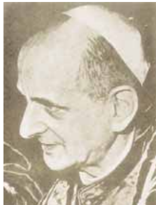
Papież Paweł VI