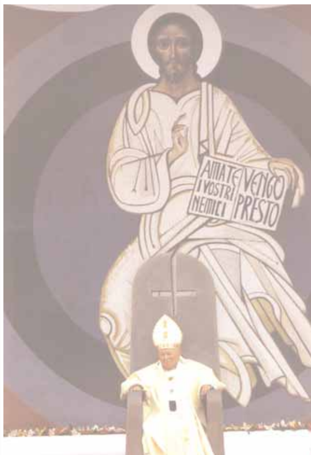
Nie bójcie się głosić prawdy! Jan Paweł II

„I ujrzałem bestię wychodzącą z morza, mającą głów siedem i dziesięć rogów, a na rogach jej dziesięć koron, a na głowach jej słowa bluźnierstwa. A bestia, którą ujrzałem, podobna była do ryśa i nogi jej jako nogi niedźwiedzia, a paszcza jej jako paszcza lwa. I udzielił jej smok swej siły i władzy wielkiej. I ujrzałem, że jedna z głów jej była śmiertelnie ranna, a jej rana śmiertelna została uleczona. Cała ziemia w podziwie spoglądała na bestię. Składano pokłon smokowi, który dał władzę bestii i oddawano cześć bestii, mówiąc: Któż podobny do bestii, i któż z nią będzie mógł walczyć. I dano jej usta, wypowiadające wielkie rzeczy i bluźnierstwa i nadano jej władzę działania na przeciąg czterdziestu dwu miesięcy. I otworzyła usta, aby wygłaszać bluźnierstwa przeciw Bogu, aby bluźnić imieniu Jego, przybytkowi Jego i tym, którzy mieszkają w niebie. I dozwolono jej toczyć walkę ze świętymi i zwyciężać ich. I nadano jej władzę nad wszystkim pokoleniem i ludem, i językiem, i narodem. A składali jej pokłon wszyscy mieszkańcy ziemi , których imiona nie są zapisane w księdze żywota Baranka zabitego do założenia świata. Jeśli kto ma ucho, niechaj słucha” (Ap 13,1-9).