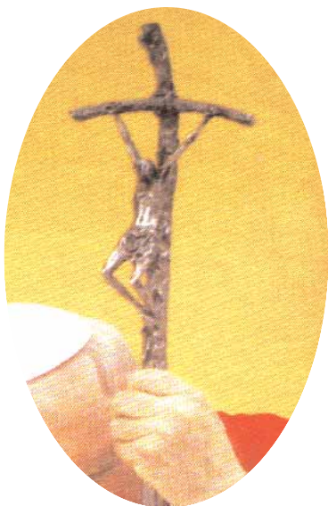
Sprofanowany Krzyż Chrystusa