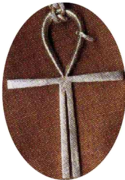
Znak Ankh – symbol uwielbienia bożka RA, zwany podstępnie krzyżem Atlantów